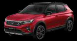
Ignite Red Metallic Two Tone (RS type)

Spesifikasi, fitur dan material dapat berbeda dengan aktual kendaraan yang dijual. Perubahan warna, material serta kelengkapan dapat berubah sewaktu-waktu tanpa pemberitahuan terlebih dahulu.