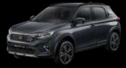
Meteoroid Gray Metallic