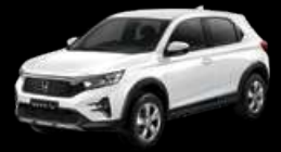
Taffeta White (E type)