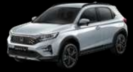
Stellar Diamond Pearl (RS type)