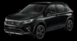
Crystal Black Pearl