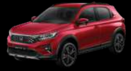
Ignite Red Metallic (RS type)