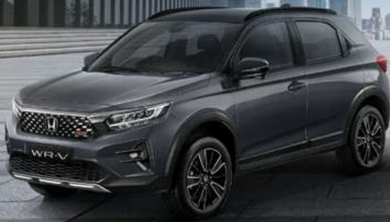
RS Type with Honda SENSING